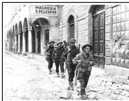
Una delle prime pattuglie alleate entra a Cesena 20 ottobre 1944